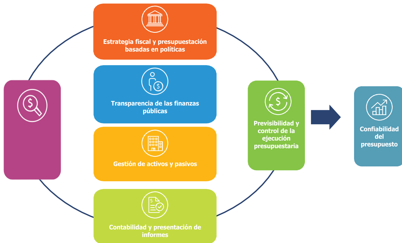
Gráfico 1: Los pilares del PEFA y el ciclo presupuestario

Dentro de las siete áreas generales que definen estos pilares, el PEFA establece 31 indicadores específicos que se centran en aspectos cuantificables clave del sistema de GFP. El PEFA utiliza los resultados de los cálculos de cada indicador, cálculos que se basan en evidencia disponible, para elaborar una evaluación integrada del sistema de GFP en cada uno de los siete pilares de desempeño. Luego, evalúa el impacto probable de los niveles de desempeño de la GFP en los tres niveles de resultados fiscales y presupuestarios previstos: disciplina fiscal global, asignación estratégica de recursos y eficiente prestación de servicios.