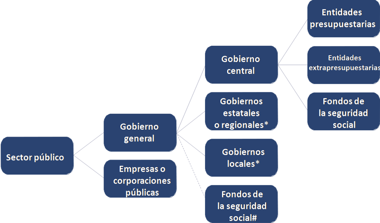
Gráfico 2: El sector público y sus principales componentes, según la definición contenida en las EFP y la denominación utilizada en el PEFA