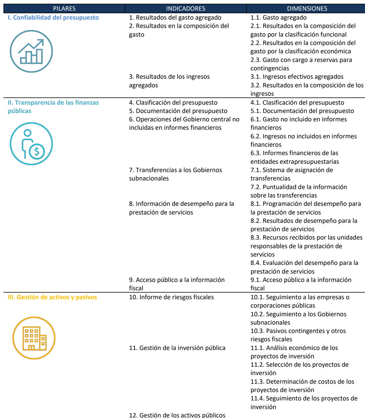
Cuadro 2: Composición de los pilares, indicadores y dimensiones PEFA

En el cuadro 2 se resumen los pilares, indicadores y dimensiones de la metodología PEFA. En la sección 3 de esta guía práctica se presentan orientaciones técnicas detalladas sobre la calificación de cada indicador.